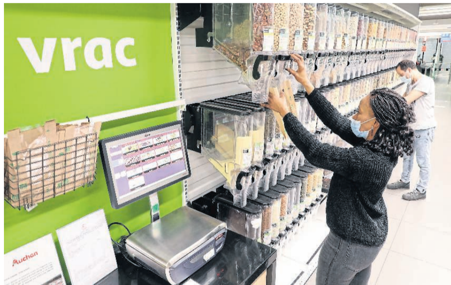
Le marché du vrac pèse aujourd'hui 1,3 milliard d'euros dont la moitié provient des rayons de la grande distribution (ci-dessus, Auchan).

Mais une fois déconfinés, les adeptes ont vite renoué avec ce mode de consommation qui convainc surtout pour ses vertus écologiques (pour réduire les emballages) mais aussi pour son côté « économique », notamment dans le bio où les produits sont souvent moins chers que